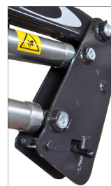
Sgancio rapido senza perni Loader quick release system