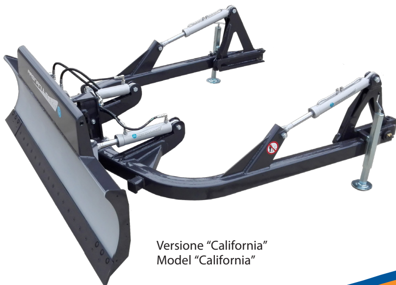
Versione "California" Model "California"

D - Lunghezza totale della lama D - Total Blade length