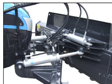
Versione "California" Model "California"